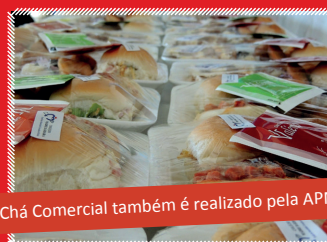
O Chá Comercial também é realizado pela APM