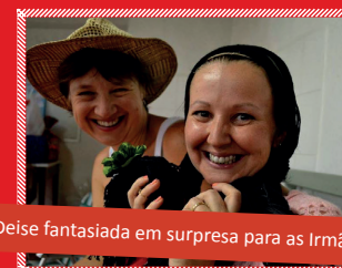
Deise fantasiada em surpresa para as Irmãs

Textos: Renata Leal Fotos: Renata Leal, professores e Mazup; Foto Capa: Renata Leal; Conselho Editorial: Maria Elena Jacques, Justine Thomas, Renata Leal, Coordenação Pedagógica e Coordenação de Cursos; Correção: Romério Schrammel; Projeto Gráfico: Integra Comunicação e Planejamento; Editoração: Renata Leal; Impressão: Grafocem Tiragem: 1.000 exemplares