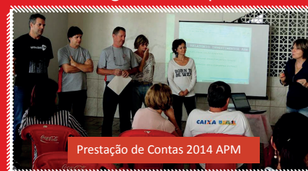
Prestação de Contas 2014 APM