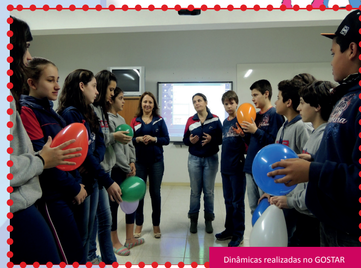
Dinâmicas realizadas no GOSTAR