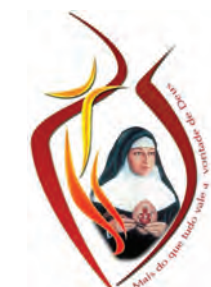
Logomarca criada para o evento

O processo de beatificação iniciou em 1993 e somente no ano passado, em 2009, a Congregação obteve resposta positiva com o reconhecimento do milagre atribuído à Bárbara Maix.