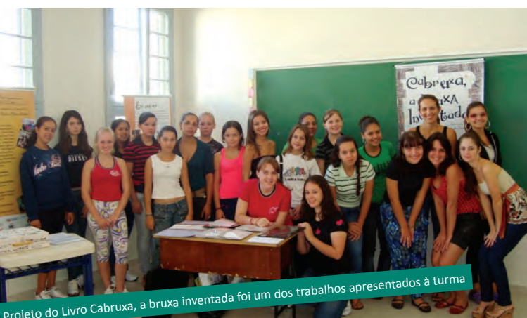
Projeto do Livro Cabruxa, a bruxa inventada foi um dos trabalhos apresentados à turma