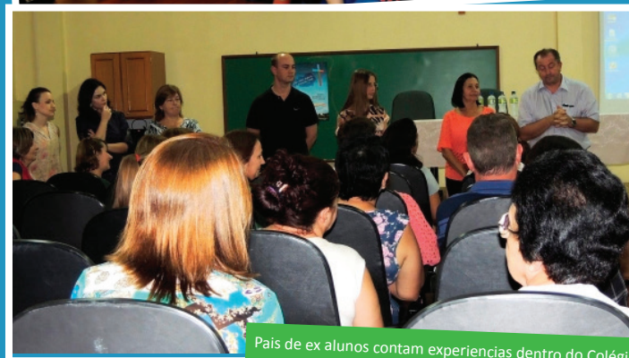
Pais de ex alunos contam experiências dentro do Colégio

Textos: Renata Leal Conselho Editorial: Maria Elena Jacques, Justine Thomas e Renata Leal