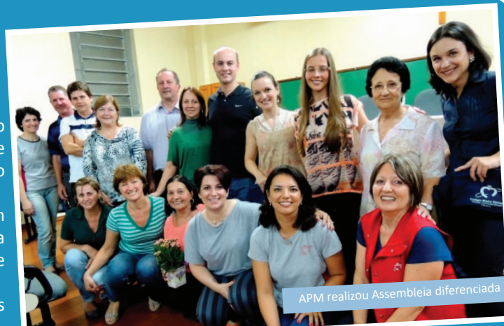
APM realizou Assembleia diferenciada

Queremos, para este ano, ter um elo maior entre pais, alunos, direção, professores, colaboradores deste Colégio, a fim de refletirmos sobre os diversos caminhos que queremos seguir. Precisamos da colaboração dos pais para realizar as promoções e para que possamos assim, investir mais na escola para o bem dos nossos alunos e comunidade.