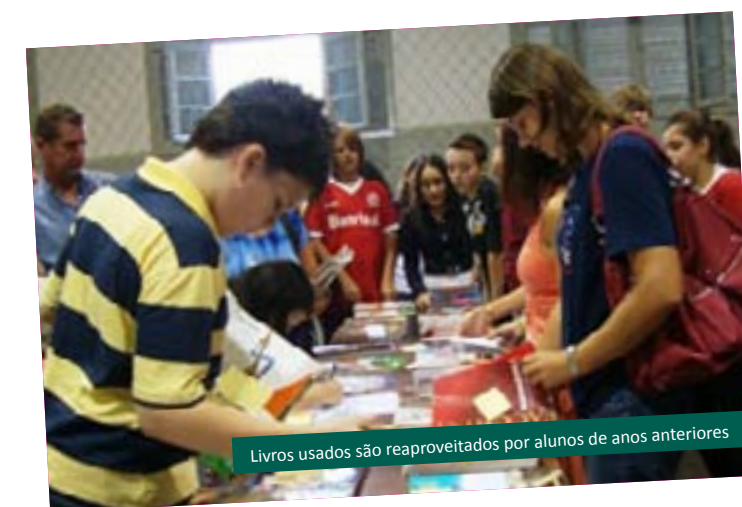
Livros usados são reaproveitados por alunos de anos anteriores