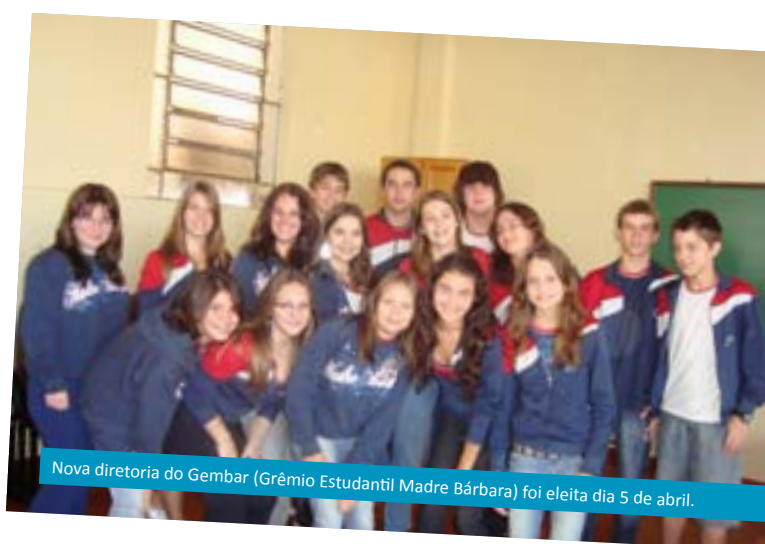
Nova diretoria do Gembar (Grêmio Estudantil Madre Bárbara) foi eleita dia 5 de abril.