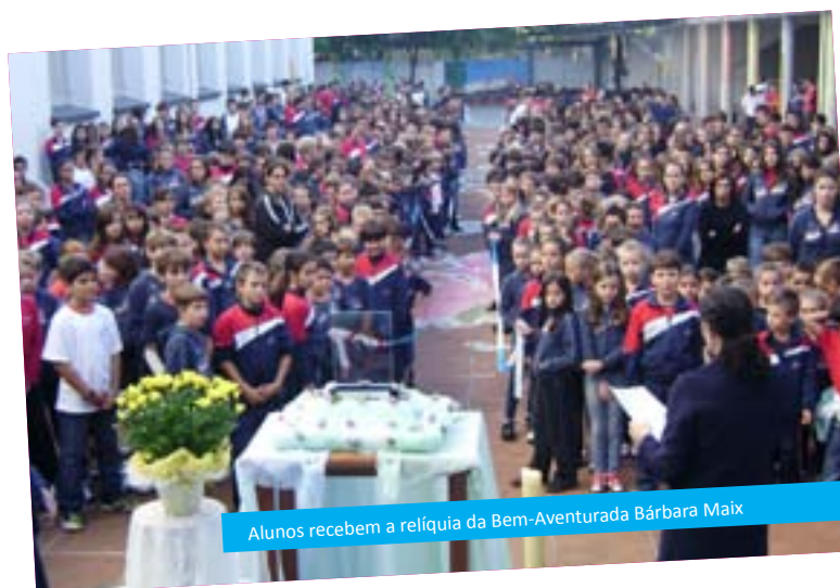
Alunos recebem a relíquia da Bem-Aventurada Bárbara Maix

O relicário contendo a Relíquia de Bárbara Maix ficará exposto na capela do Colégio Madre Bárbara. Poderá ser visitado durante o horário de funcionamento do mesmo. Segundo classificação da Igreja Católica, a Relíquia de Bárbara Maix é de 1ª classe, pois é uma parte do corpo da Bem-Aventurada (fragmento de um osso).