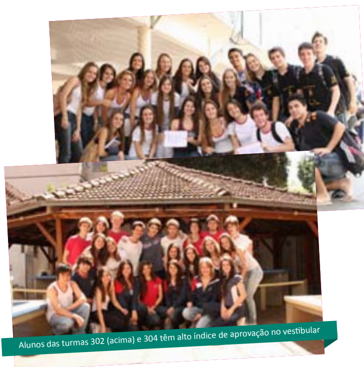
Alunos das turmas 302 (acima) e 304 têm alto índice de aprovação no vestibular