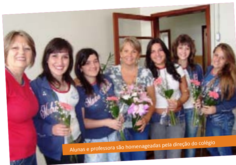
Alunas e professora são homenageadas pela direção do colégio