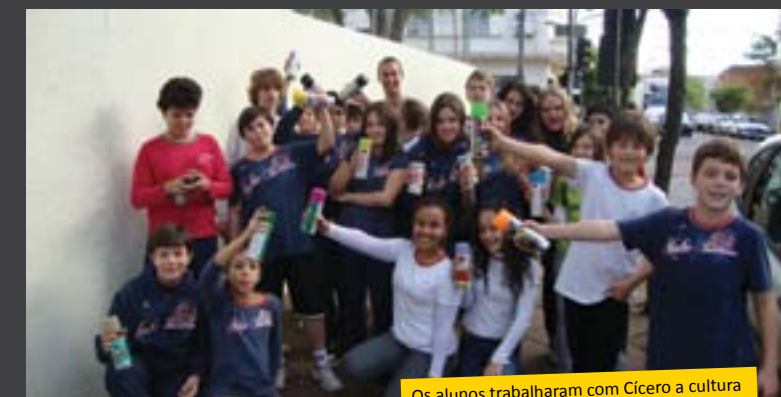
Os alunos trabalharam com Cícero a cultura e as técnicas deste estilo de arte de rua

De acordo com Cícero, o objetivo deste trabalho no colégio é contribuir para a divulgação da mensagem de Bárbara Maix no ano de sua beatificação utilizando da arte do graffiti que, segundo ele, comunica aos jovens e à população em geral.