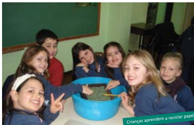
Crianças aprendem a reciclar papel