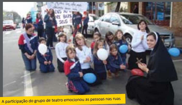
A participação do grupo de teatro emocionou as pessoas nas ruas