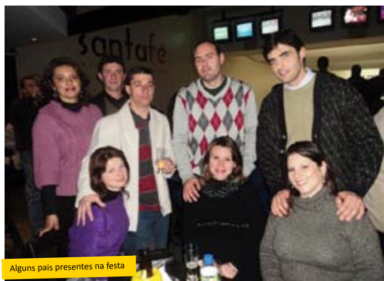
Alguns pais presentes na festa