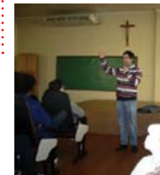
Mercado de trabalho, taxas de juros, pagamento à vista e bolsa de valores foram alguns temas abordados

A palestra deste dia foi a primeira parte do projeto que ainda conta com mais uma etapa, que será um curso com duração de quatro horas para uma turma de alunos interessados nesta continuidade e, que, no final, receberão certificado.