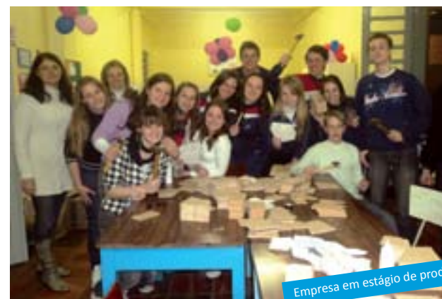
Empresa em estágio de produção