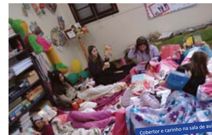
Cobertor e carinho na sala de aula