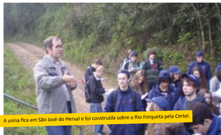
A usina fica em São José do Herval e foi construída sobre o Rio Forqueta pela Certel.