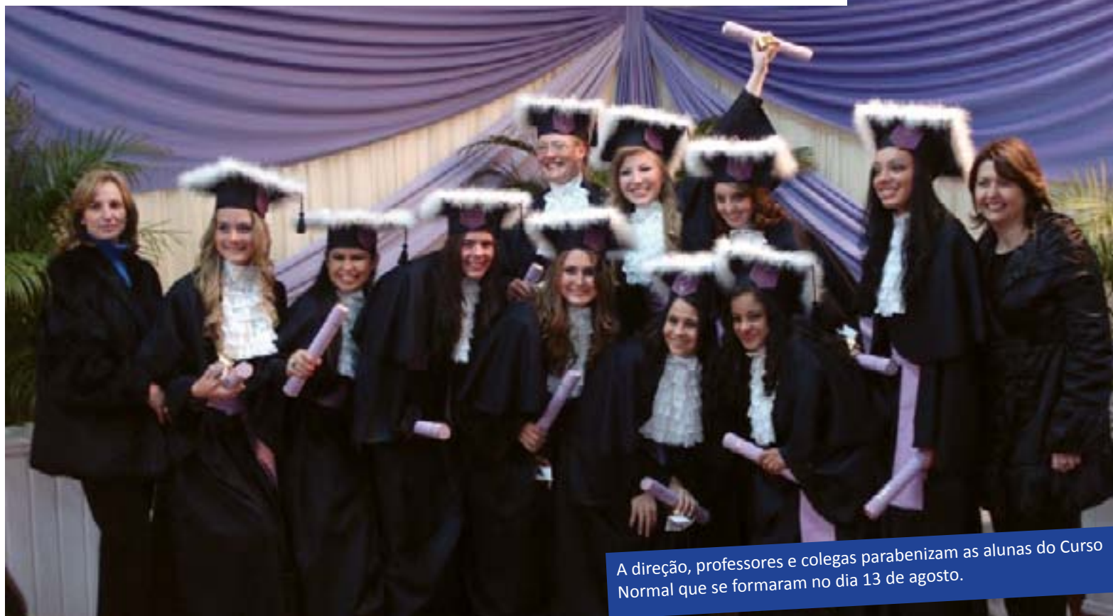
A direção, professores e colegas parabenizam as alunas do Curso Normal que se formaram no dia 13 de agosto.